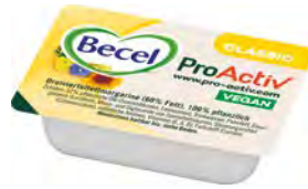
Pro-Activ Margarine 60% 200x10g