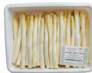
Spargel geschält fein, weiß – violett * Kaliber 14 – 18 mm, 4 kg