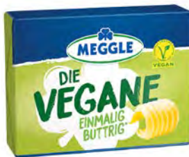
Die Vegane 16 x 250g