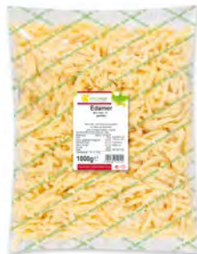
Salatkäse Edamer Stifte 40% 1 kg