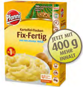
Kartoffelflocken fix-fertig m Milch 4 kg