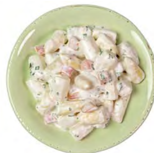
Spargelsalat Schwetzingler Art * 1kg