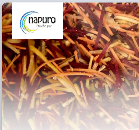
Wurzelmix 3er Stifte 1 kg