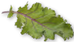
Junger Grunkohl (Curly Kale) 200 g