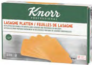
Lasagne Platten 50 Stück 10 kg