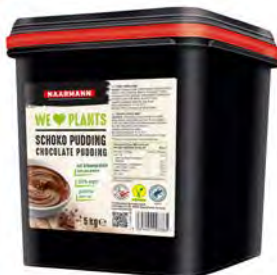
H-Pudding Schoko vegan 5kg