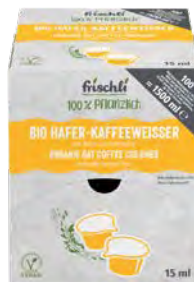
Bio Hafer-Kaffeeweiser 100 x 15ml