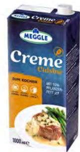
Creme Cuisine 15% 12x1 kg