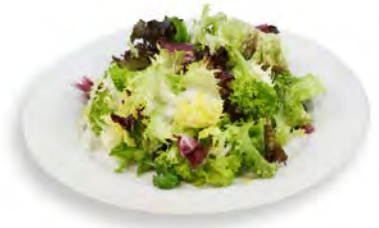
Blattsalatmix Manhattan Mix aus Lollo Bionda, Loolo Rosso, Frisee, Radicchio, Rucola 500 g