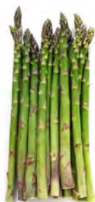
Spargel grün, deutsch * Klasse I, 500g Bund