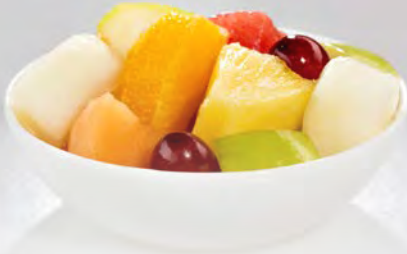
Fruchtsalat Valencia 3 kg