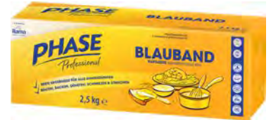
Blauband Margarine 80% 2,5kg