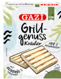
Grillgenuss vegan Kräuter 7 x 160g