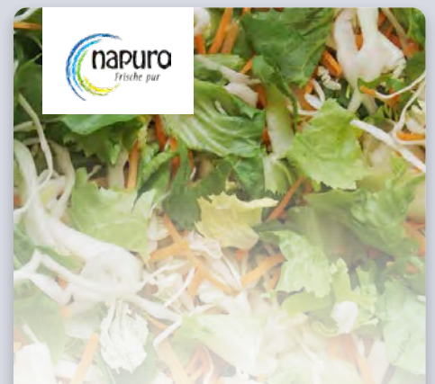
Mischsalat Start up 1 kg