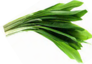
Barlauch 100 g