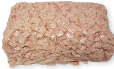
Jagdwurst Würfel 1cm 2 kg