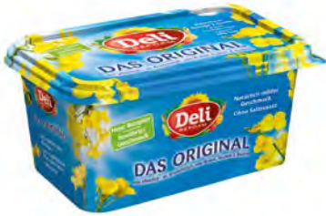
Deli Reform 70% 16x500g