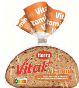
Vital & Vitamin mit Karotte und Ölsaaten 7 Scheiben 400g