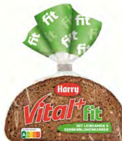
Vital & Fit Malzmehrkorn 9 Scheiben 500g