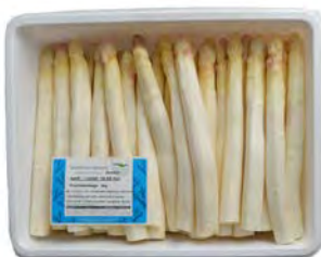
Spargel geschält, weiß – violett * Kaliber 16 – 28 mm, 4 kg