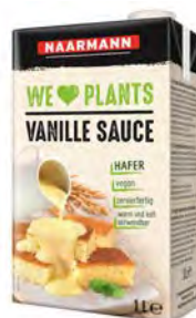
H-Sauce Vanille vegan 12 x 1l