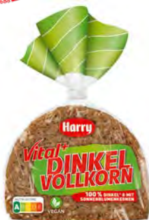
Vital & Dinkel Vollkorn 8 Scheiben 300g