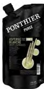
Gemüsepuree Weißer Spargel * 1kg, aus 100% weißem Spargel