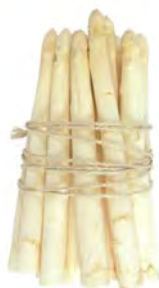
Deutscher Spargel weiß * 16+, Klasse I, 5kg Karton