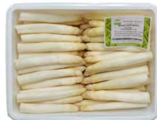
Spargel weiß Spitzen ca. 11cm * aus Kaliber 16 – 26 mm auf 11cm Länge geschnitten