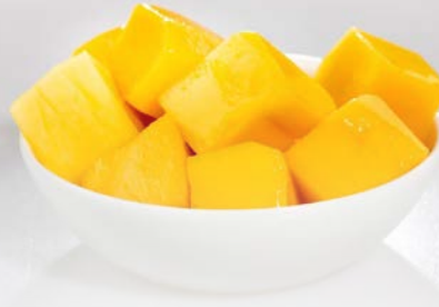
Mangowurfel 3 kg