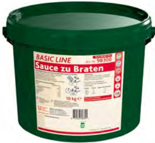
Bratensauce 10 kg