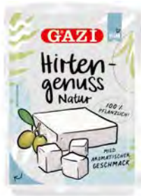
Hirtenkäse vegan natur 6 x 150g