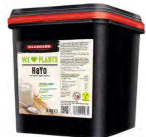
HaYo Vegan 5kg