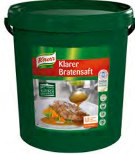
Bratensaft klar 12,5 kg