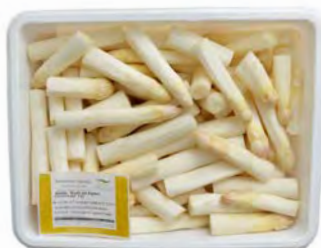
Spargel geschält, weiß – violett * Stücke, Länge ca. 30 – 80 mm, 4 kg