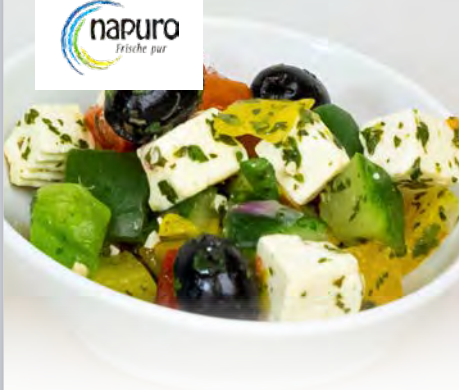
Rohkostmix Griechisch 2 kg (Schale)