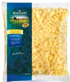
Gouda Würfel 48% 6mm 1 kg