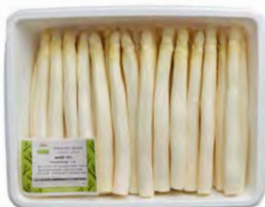
Spargel geschält, weiß * Kaliber 16 – 26 mm, 4 kg