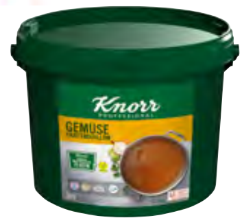
Gemüse Kraftbouillon 12,5kg