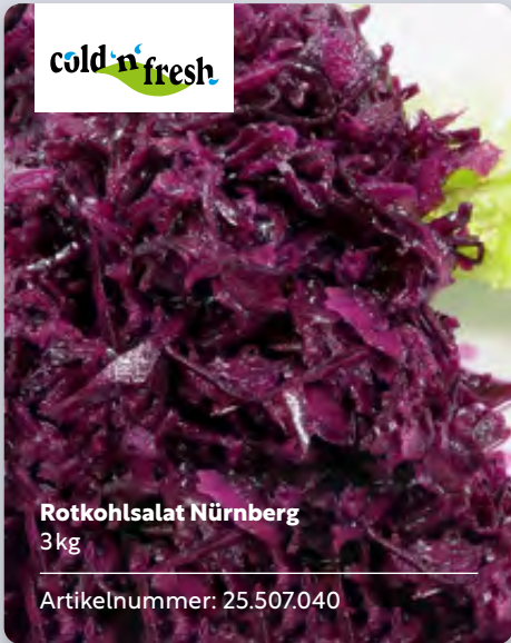
Rotkohlsalat Nürnberg 3kg