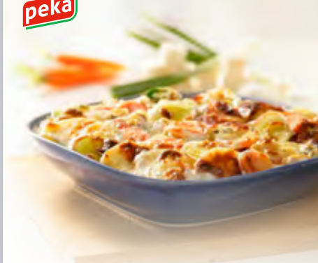
Kartoffelauflauf mit Gemüse 2kg