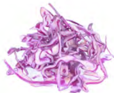
Rotkohl Streifen 2,5kg