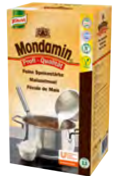
Feine Speisestärke 2,5kg