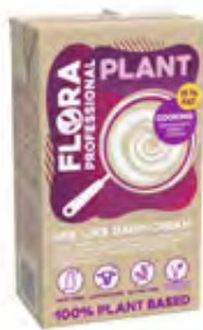
Flora Professional Plant zum Kochen 15% 8x1l