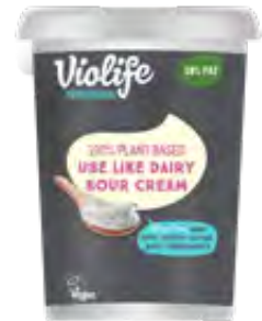
Pflanzliche Sour Cream Alternative 6x500g