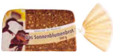
Sonnenblumenbrot geschnitten 8 Scheiben 500g