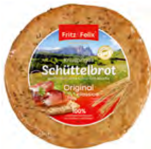
Schüttelbrot Original 20x150g