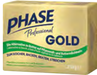
Professional Gold 72% 20x250g