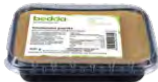
Vegane Frischcreme Paprika 500g