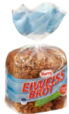
Eiweißbrot geschnitten 12 Scheiben 500g