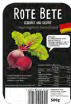
Rote Bete geschält und gegart 500g