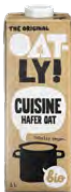
Bio Hafer Cuisine 6x1l