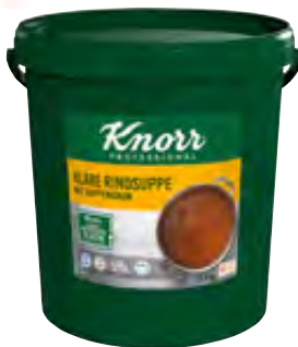
Klare Rindsuppe 12,5kg