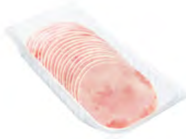
Hinterkochschinken 30 Scheiben 500g