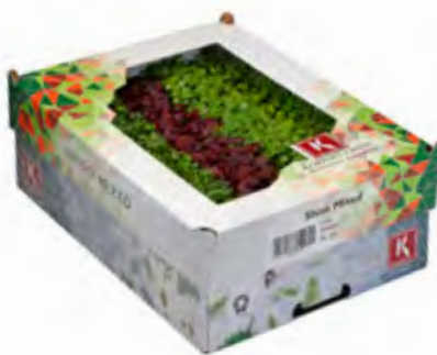
Kresse Shiso Mix