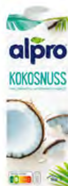
Kokosnuss Drink 8x1l