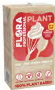
Flora Professional Plant zum Schlagen 31% 8x1l