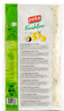
Kartoffelauflauf mit Trüffel 2kg