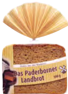
Paderborner Landbrot geschnitten 8 Scheiben 500g