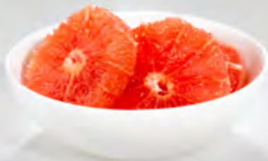
Grapefruit Scheiben 2,5kg