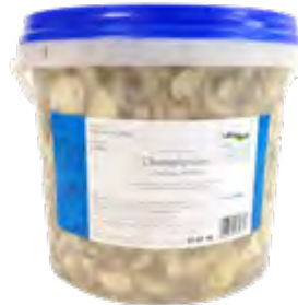
Champignons geschnitten 3. Wahl 9,1kg (ATG 6kg)