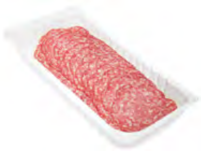
Salami la Mediterano 60 Scheiben 500g