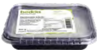
Vegane Frischcreme Kräuter 500g