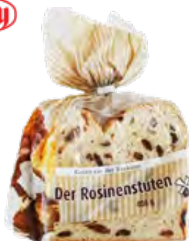
Rosinenstute geschnitten 6 Scheiben 400g