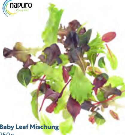
Baby Leaf Mischung 250g