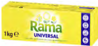
Rama 72% 1kg