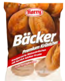
Premium Krüstchen zum Fertigbacken 6x80g