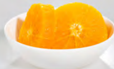
Orangen Scheiben 2,5kg