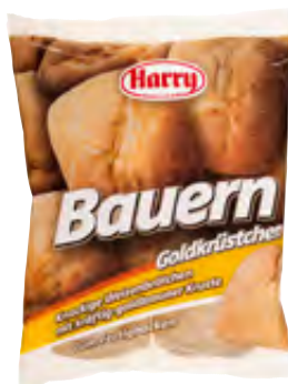
Goldkrüstchen zum Fertigbacken 6x80g