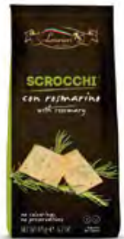
Scrocchi mit Rosmarin 12x175g