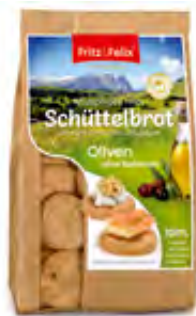
Schüttelbrot Mini Olive 12x125g