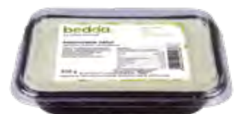
Vegane Frischcreme natur 500g