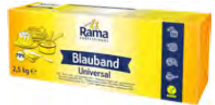
Blauband Streichfett 79% 2,5kg