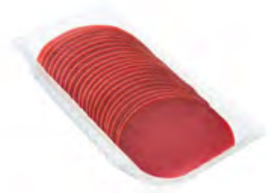
Cervelatwurst 42 Scheiben 500g