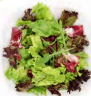
Blattsaladmischung Manhattan 500g