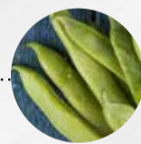
BUSCH- UND STANGENBOHNEN (Deutschland)