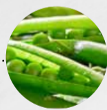
SCHOTEN/ ERBSEN (Deutschland)