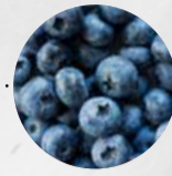
WALDHEIDELBEEREN/ BLAUBEEREN (Deutschland, Polen)