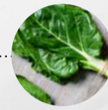
MANGOLD bunt (Deutschland)