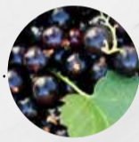
JOHANNISBEEREN schwarz (Deutschland)