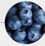
KULTUR- HEIDELBEEREN (Deutschland)