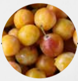
MIRABELLEN (Frankreich, Deutschland)