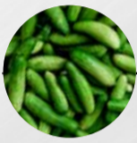
SCHMOR-, LAND- & EINLEGEGERURKEN (Deutschland)