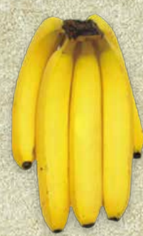
FARBSTUFE 6: VOLLGELB

Bestes Reifestadium zum Verkauf an den Konsumenten