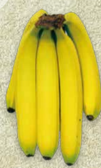
FARBSTUFE 5: GELB MIT GRÜNEN SPITZEN

Üblicher Zeitpunkt der Auslieferung an den Einzelhandel