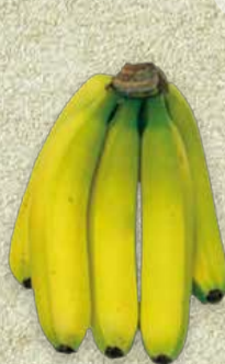
FARBSTUFE 4: MEHR GELB ALS GRÜN

Auslieferung an den Einzelhandel bei höheren Außentemperaturen