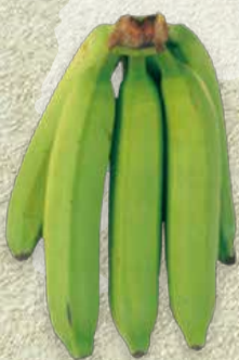
FARBSTUFE 2: HELLGRÜN