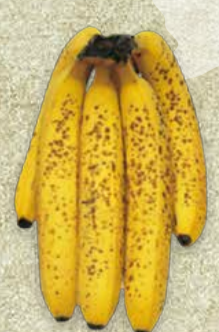
FARBSTUFE 7: VOLLGELB MIT ZUCKERFLECKEN