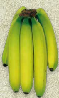
FARBSTUFE 3: MEHR GRÜN ALS GELB

Auslieferung an den Einzelhandel bei höheren Außentemperaturen